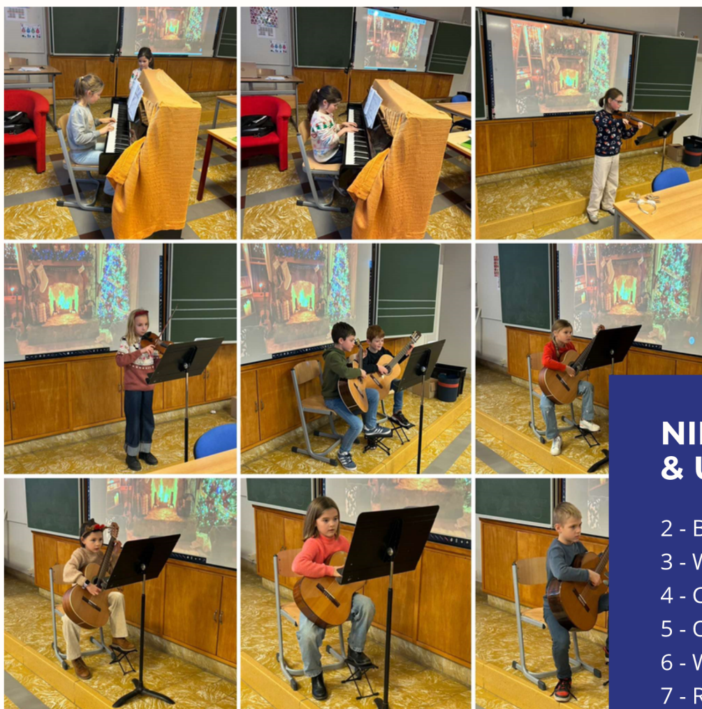
KERSTCONCERT AARSELE LEERLINGEN 2.1 EN 2.2